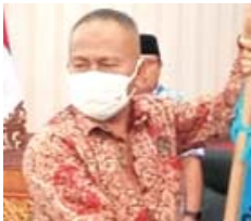
ATAL S DEPARI

Ini sisi lain dari pelaksanaan Konferensi Provinsi (Konferprov) XII PWI Sumbar yang digelar di Aula Kantor Gubernur Sumbar, Sabtu (23/7).