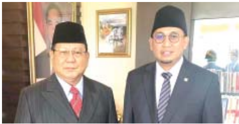
BERSAMA - Prabowo Subianto bersama Andre Rosiade.

Menurut Andre Rosiade, ketokohan itu juga sangat terlihat pada hasil Pemilihan Presiden (Pilpres) 2019 di Sumbar. Pasangan Prabowo-Sandi menang telak 85,95% sedangkan