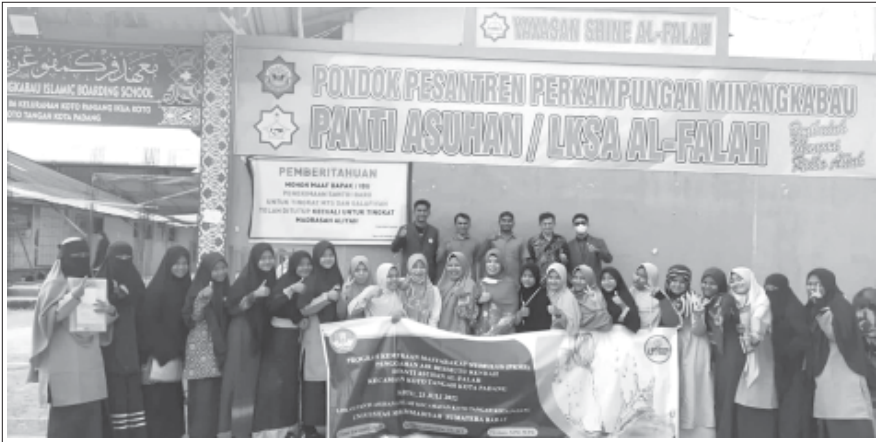
BERSAMA Tim Pengabdian kepada Masyarakat (PKM) UM Sumbar dan STIKES Mercubaktijaya bersama warga Panti Asuhan (PA) Al-Falah, Kecamatan Koto Tengah, Padang, Sabtu (23/7).