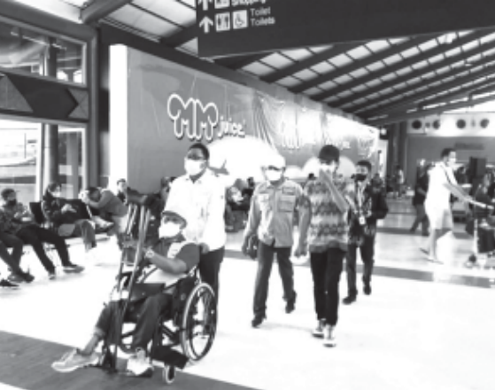
Sekitar 100 atlet dan official peserta Asean Para Games 2022, Minggu (25/7) sudah mulai berdatangan di Bandara Soekarno-Hatta melakukan transit untuk melanjutkan penerbangan menuju Surakarta, tempat di selenggarakannya Asean Para Games 2022 dari 30 Juli-6 Agustus mendatang. (yusman)

"Adapun Bandara Soekarno-Hatta merupakan salah satu bandara dengan fasilitas disabilitas terlengkap. Layanan disabilitas yang terdapat di bandara-bandara AP II merujuk pada PM Nomor 98 Tahun 2017 tentang Penyediaan Aksesibilitas Pada Pelayanan Jasa Transportasi Publik Bagi Pengguna Jasa Berkebutuhan Khusus," pungkas Agus Haryadi. (602)