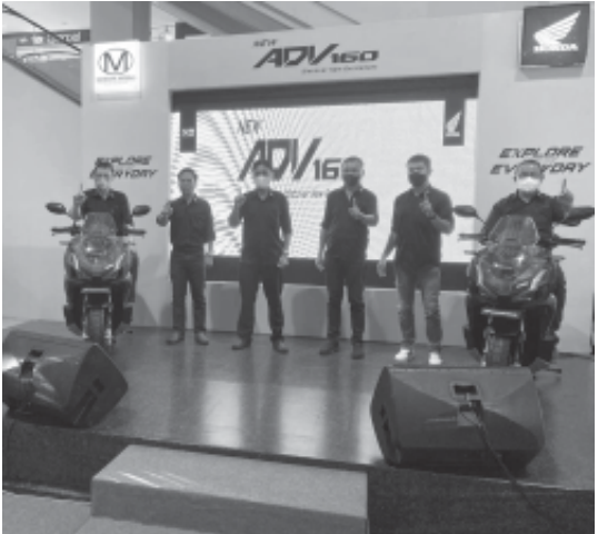
KENALKAN - Jajaran Management PT. Menara Agung memperkenalkan New Honda ADV160 di Basko Grand Mall, Sabtu (23/7).