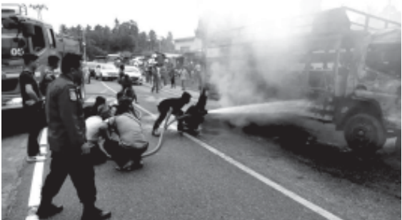
PADAMKAN - Pemadam Kebakaran membantu memadamkan api.