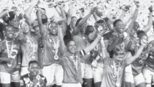
Para pemain timnas putri Afrika Selatan mengangkat trofi juara Piala Afrika setelah mengalahkan Maroko di Prince Moulay Abdellah Stadium, Maroko, Sabtu (23/7) waktu setempat.