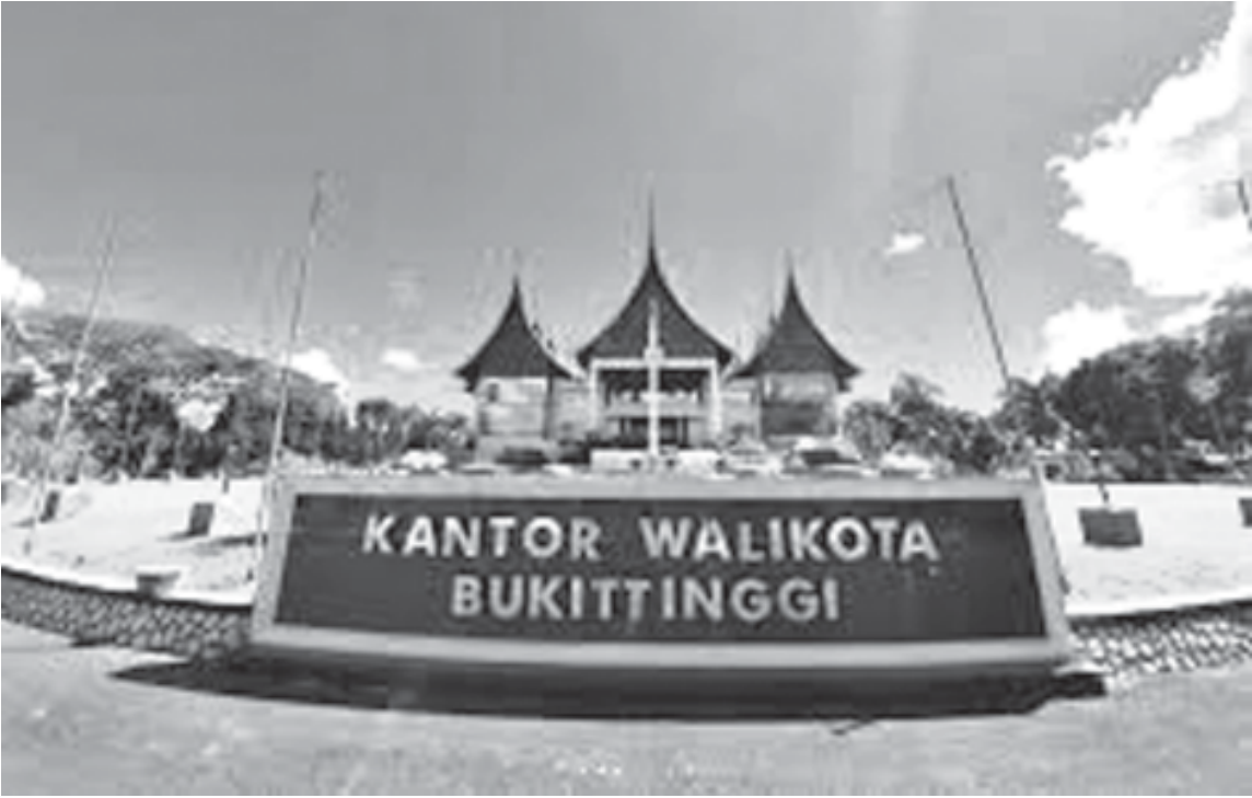
BALAIKOTA – Kantor Balaikota Bukittinggi di Jalan Kesuma Bhakti No. 1, Bukit Gulai Bancah, Mandiangin Koto Selayan, Bukittinggi.