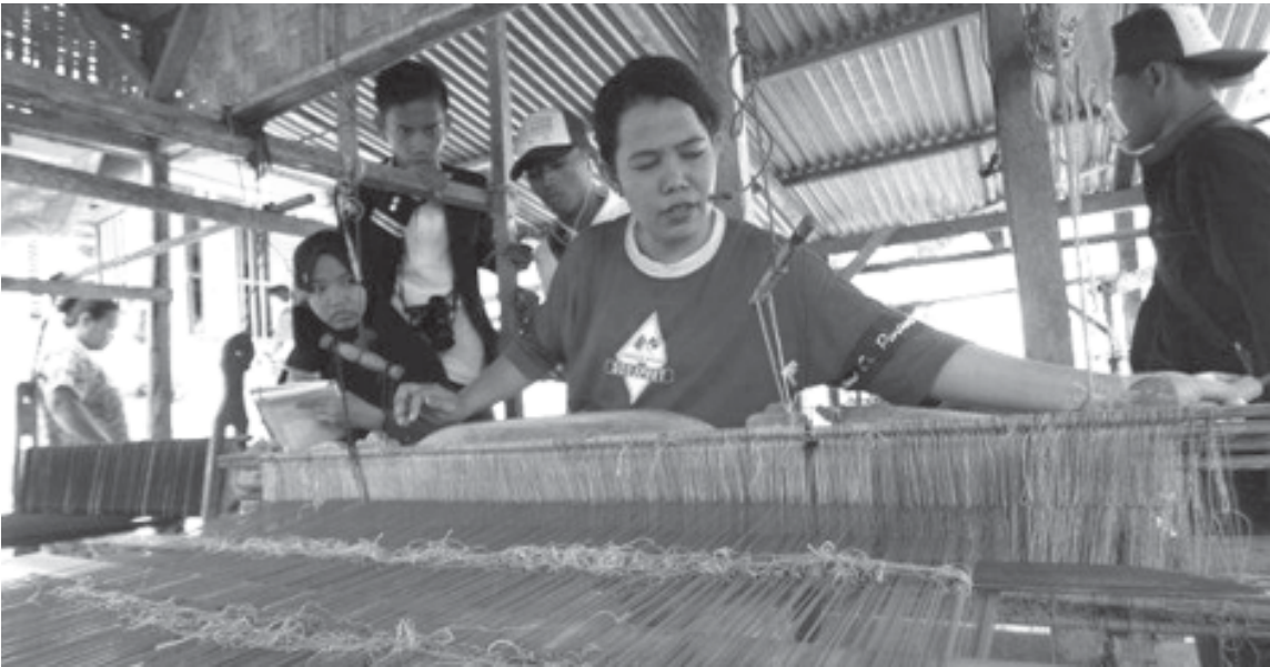
TENUN SONGKET - Sejumlah siswa melihat proses pembuatan tenunan kain songket Batubara saat berkunjung di Batubara, Sumatera Utara, pekan lalu. Sebanyak 19 pelajar berprestasi asal Sulawesi Barat tersebut melakukan perjalanan ke Sumut sebagai bagian dari program Siswa Mengenal Nusantara yang bertujuan seluruh siswa dapat mengenal budaya, adat istiadat dan memberikan wawasan yang lebih luas dalam mengenal nusantara.