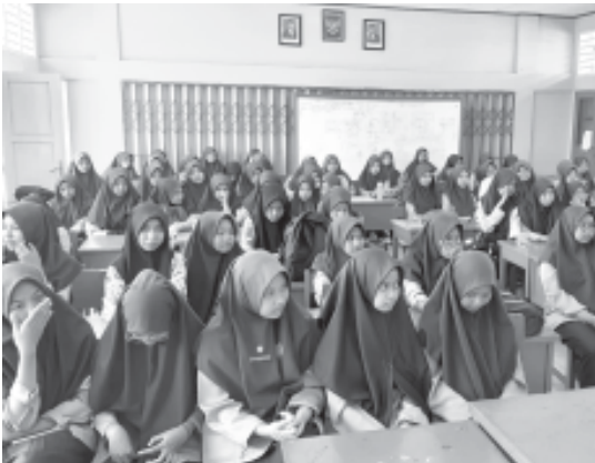
LATIHAN - Sebanyak 207 orang siswa kelas X SMA Negeri 1 Tanjung Raya, Agam mengikuti latihan pramuka sebagai ekstrakurikuler wajib, Sabtu (23/7) di gedung SMANTARA Maninjau.

Pelatihan dimulai dengan membentuk kelompok yang diatur dalam Sangga kerja sebanyak 10 kelompok Sangga putra dan 16 Sangga putri. (210)