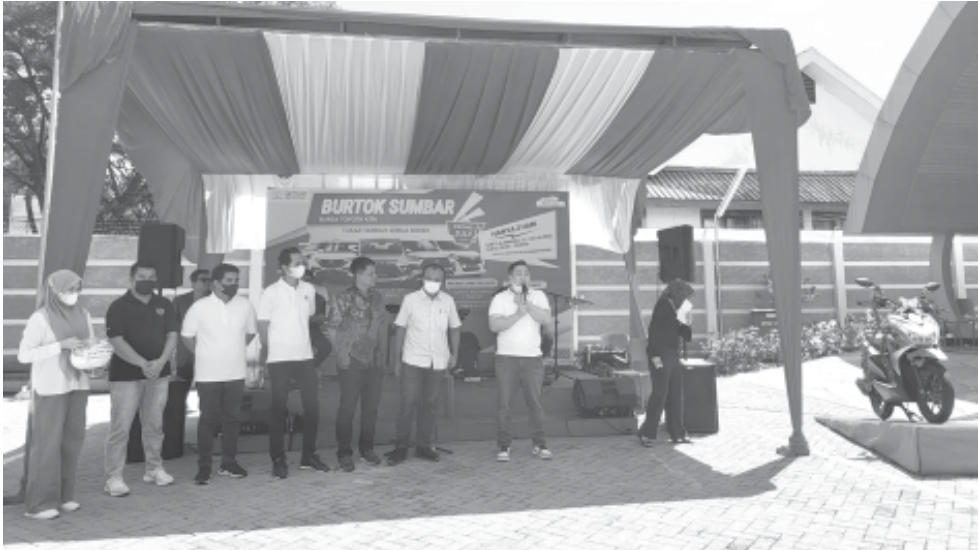
REWARD - Area Bussiness Manager Auto 2000 Sumbar, Cevano didampingi perwakilan TAF, ACC Padang serta Kepala Dinas Sosial Padang dan Notaris saat pencabutan nama konsumen untuk pemberian reward di Showroom Auto 2000 Khatib Sulaiman, Sabtu (23/7).