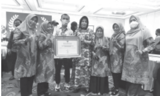
TERIMA - Forum Anak Daerah Kabupaten Pesisir Selatan menerima penghargaan dari KPAI. (ist)

Kemudian Pemerintah Provinsi Sumatera Barat juga akan memberikan penghargaan kepada Forum Anak Daerah Kabupaten Pesisir Selatan pada Peringatan Hari Anak Tingkat Provinsi Sumatera Barat, Senin (25/7) di halaman kantor Gubernur Sumbang. (214)