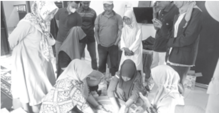
KELUARGA - Kegiatan pendampingan LPPM UNES dan Vicra untuk peningkatan perekonomian keluarga, diikuti Kelompok Petani Perempuan Nagari Tanjung Aur, Pakandangan, Kecamatan Enam Lingsung, Kabupaten Padang Pariaman.

Perlu didorong partisipasi aktif dari masyarakat rentan khususnya perempuan dalam menghadapi perubahan iklim. Isu perempuan dan perubahan iklim merupakan satu kesatuan yang tidak bisa dipisahkan. Perempuan punya peran penting baik dalam antisipasi, mitigasi, maupun orientasi perubahan iklim.