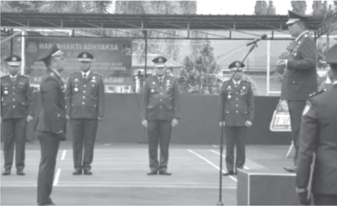
HAB - Jajaran kantor Kejaksaan Negeri (Kejari) Agam menggelar upacara peringatan Hari Bhakti Adhyaksa (HBA) ke-62, Jumat (22/7).