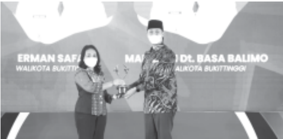
Walikota Erman Safar saat menerima penghargaan KLA tahun 2022 di Bogor pekan lalu. (ist)

Penialan pada kategori Nindya ini, lebih difokuskan pada klaster lingkungan keluarga dan pengasuhan, klaster kesehatan dan kesejahteraan, klaster pendidikan, pemanfaatan waktu luang dan kegiatan budaya serta klaster perlindungan khusus anak. (as)