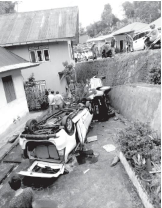
TERGELETAK – Dua minibus terguling di halaman rumah warga, setelah terjun dari jalan raya yang berada pada posisi di atas bangunan pada ketinggian sekitar lima meter, pada jalan provinsi Kubukarambie-Batusangkar.

Selanjutnya terhadap tersangka beserta barang bukti dibawa ke Polresta Padang untuk proses lebih lanjut. Pelaku terancam hukuman sebagaimana pasal 303 ayat 1 nomor ke 2 dalam kitab undang-undang hukum pidana (KUHP). (014)