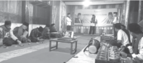
PASAMBAHAN - Peserta lomba pasambahan di Nagari Lasi, Kecamatan Candung, unjuk kebolehan di hadapan dewan juri.