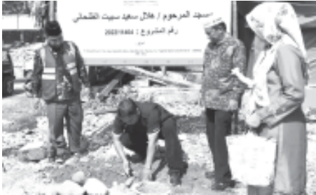
BATU PERTAMA - Sekretaris MDMC PWM Sumbar Portito meletakkan batu pertama pembangunan kembali masjid yang rusak akibat gempa, di Komplek MIS Al-Wahid Kampuang Tengah Nagari Kajai, Pasaman Barat.

MDMC PWM Sumbar juga menggelar beberapa kegiatan yang mengarah ke pembinaan ibadah dan sikap mental, termasuk menyelenggarakan Shalat Id, melaksanakan ibadah kurban, dan memasak daging hewan di lokasi bencana. (211)