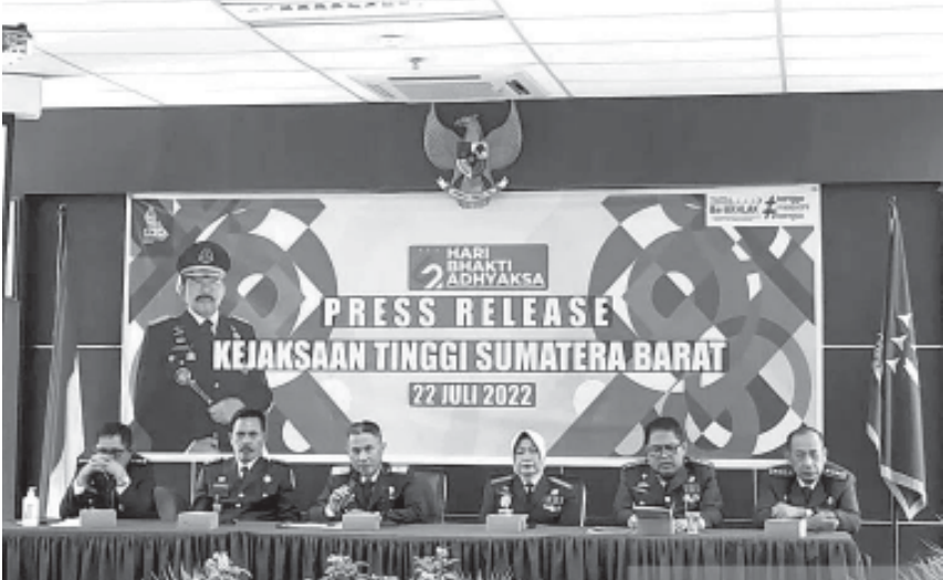
JUMPA PERS - Kepala Kejaksaan Tinggi Sumbat Yusron saat jumpa pers dalam memperingati Hari Bhakti Adhyaksa di Kantor Kejati Sumbat, Jumat (22/7).

Sebelumnya, kasus itu adalah dugaan korupsi dalam proyek pembangunan gedung kebudayaan Sumbat (lanjutan) di Taman Budaya Sumatera Barat yang memiliki pagu anggaran Rp31 miliar lebih.