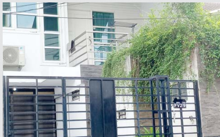
BEKAS rumah tempat Restoran Babiambo menjual randang babi secara online, di Kawasan Kelapa Gading Timur, Jakarta Utara. SYAFRI AMIR

Alamat tersebut berada di Jl. Gading Elok III Blok FV 2 No. 9 Rt. 004 Rw. 09