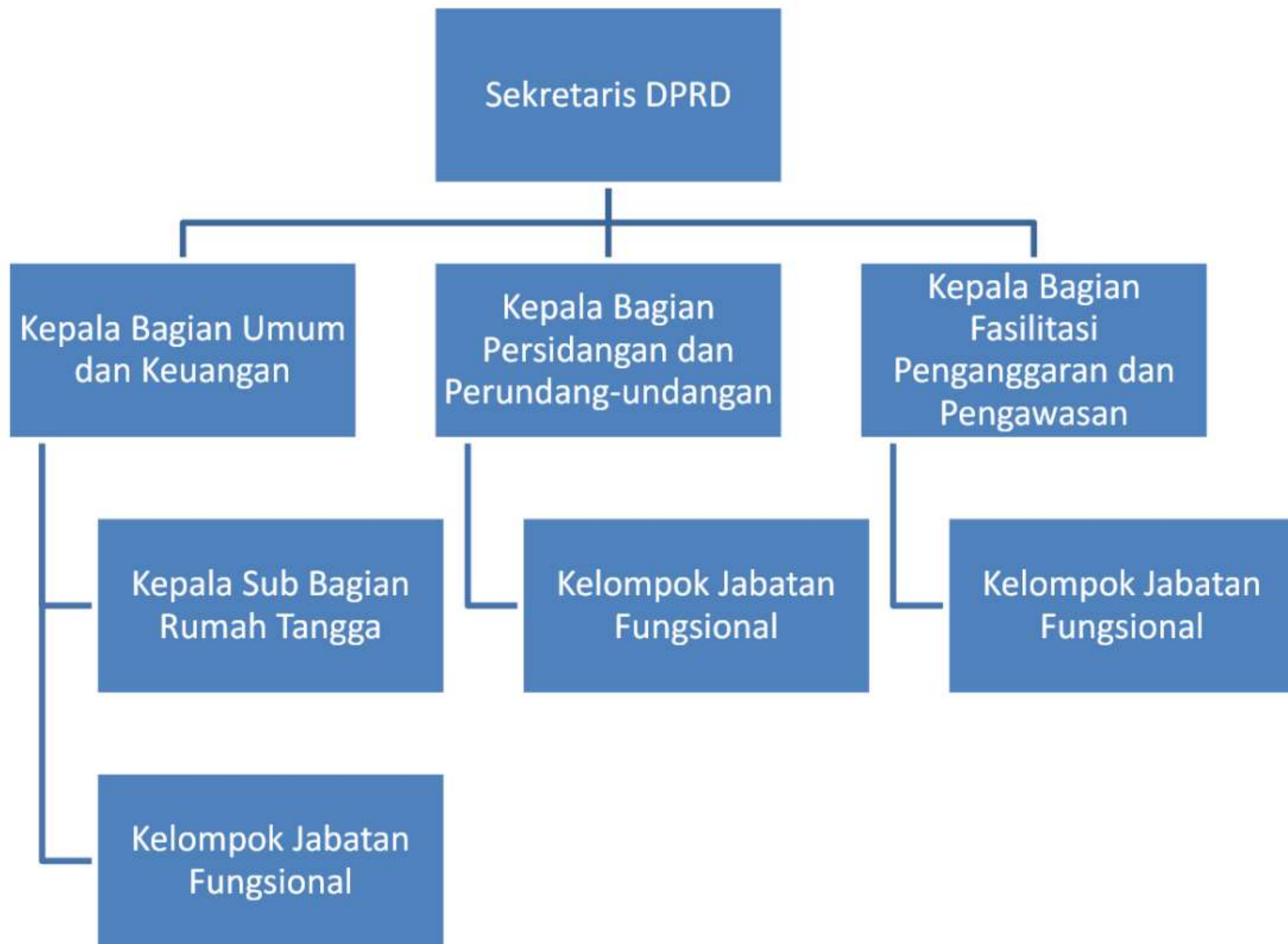
Gambar 2.1 BAGAN STRUKTUR ORGANISASI SEKRETARIAT DEWAN PERWAKILAN RAKYAT DAERAH