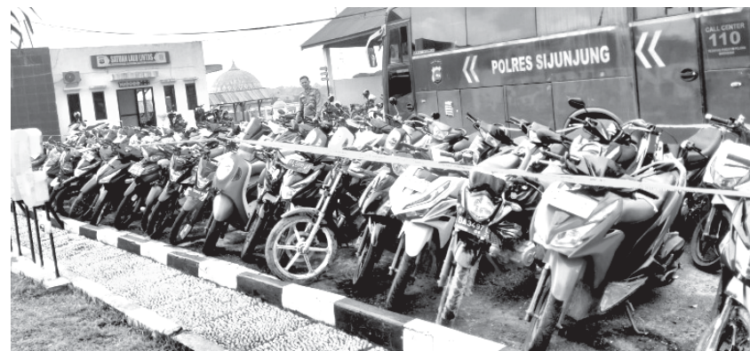
PERIKSA - Petugas memeriksa kondisi sepeda motor yang terjaring razia knalpot brong di Mapolres Sijunjung. (ist)

"Warga langsung membawa korban ke Rumah Sakit Adnan WD Payakumbuh dan jasad korban sudah diserahkan kepada pihak keluarga," katanya. (411)